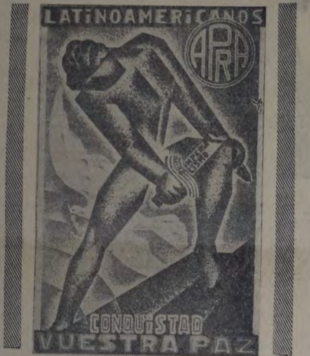
DOS HERMOSOS CARTELES PUBLICADOS POR LA A. P. R. A.

consecuencia de un desplazamiento de la estructura europea, los puntos de contacto y de obligación tenían y tienen que ser mayores y reales. Los capitales de las empresas imperialistas, incorporados en el país, tienen, pues, la marcha de la economía en sus manos, puesto que son los más poderosos y son los que constituyen el centro alrededor del cual gira la actividad económica de la nación. Esto ocurre también, y con mayor heremona, aún, en los demás países de América. Por algo, con mucho acierto, ha dicho Haya de la Torre: el capitalismo de nuestra América es el imperialismo".