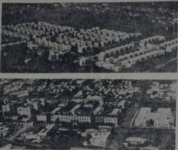
LA FOTOGRAFIA SUPERIOR MUESTRA EL PROGRESO DE LA ZONA SUBURBANA EN QUE SE ENCUENTRAN UBICADOS LOS HOSPITALES ROSARIO E ITALIANO. LA INFERIOR PERMITE Apreciar, en conjunto, el estado actual de las construcciones económicas destinadas a la vivienda de empleados y obreros